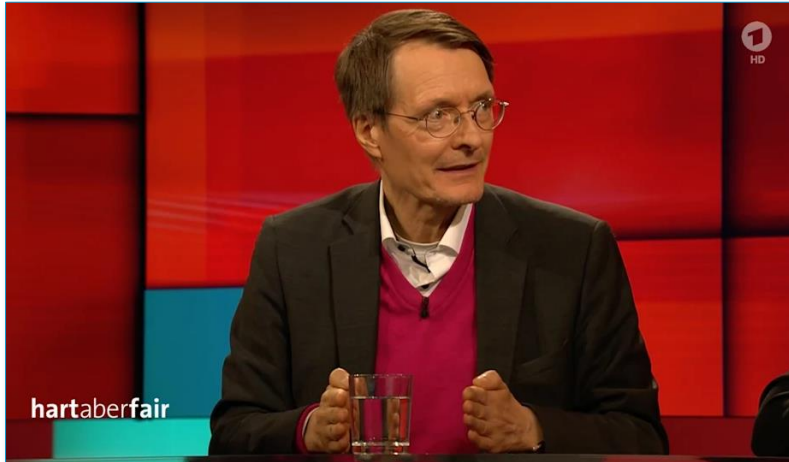
Karl Lauterbach sprach bei „Hart aber fair“ auch über die Pflege seiner Mutter (88)